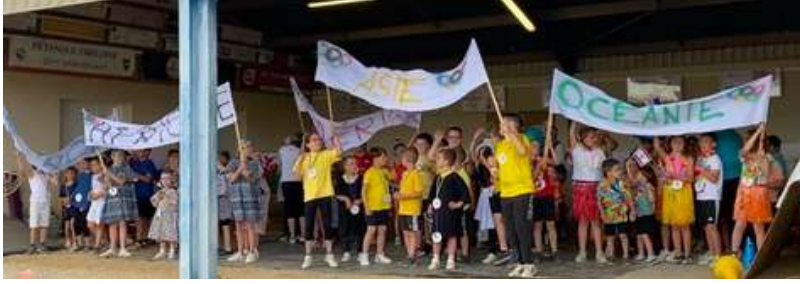
le 6 juillet fête des écoles "pluvieuse" sur le thème des Jeux Olympiques