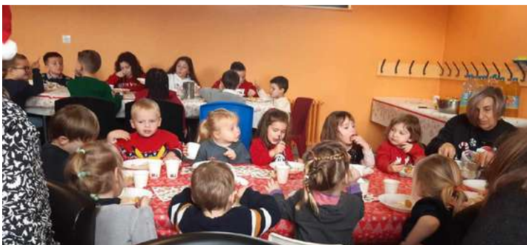
le 20 décembre : repas de Noël des enfants à la cantine