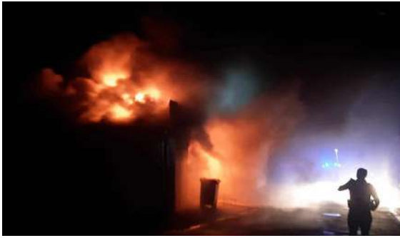
le 5 septembre : incendie du local communal