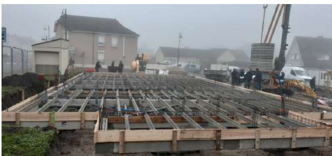
octobre : début du chantier de la halle-restaurant