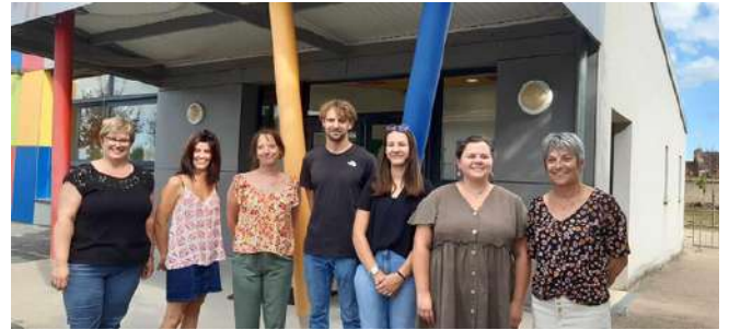
septembre 2025 : l'équipe enseignante prête pour la rentrée