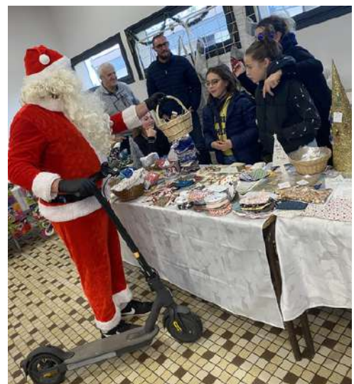
les 13 et 14 décembre : marché de Noël