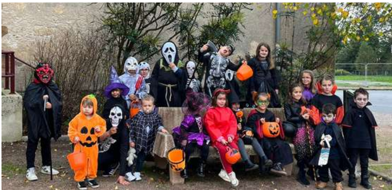
le 31 octobre : les petits thiélois fêtent "halloween"