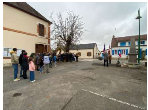
le 11 novembre : Cérémonie Armistice 14/18