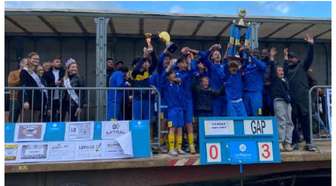
le TIFM remporté par l'équipe de GAP