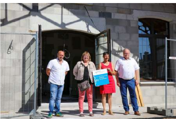
visite des Conseillers Départementaux le 11 Juillet