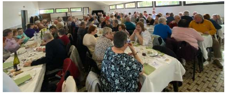
repas du CCAS le 23 mars