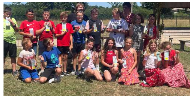
remise des calculatrices aux futurs collégiens, le 4 Juillet