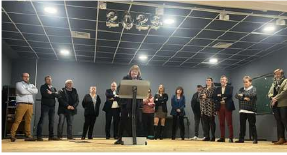
vœux du Maire le 17 janvier