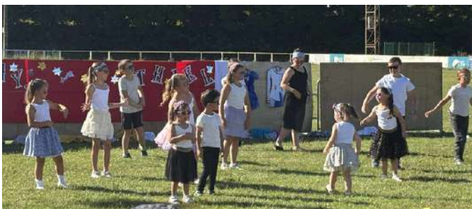
fête des écoles le 28 juin