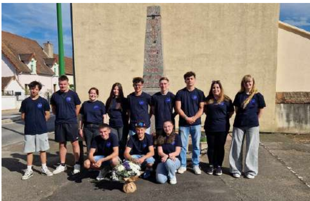
retour du bal des Conscrits à Thiel, après plusieurs années d'absence, le 10 Mai