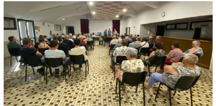
le 12 juin : projection gratuite du film de Thierry MARTIN-DOUYAT, "Allier et Saône et Loire, la ligne de démarcation"