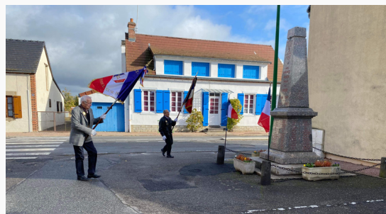
Cérémonie du 11 novembre