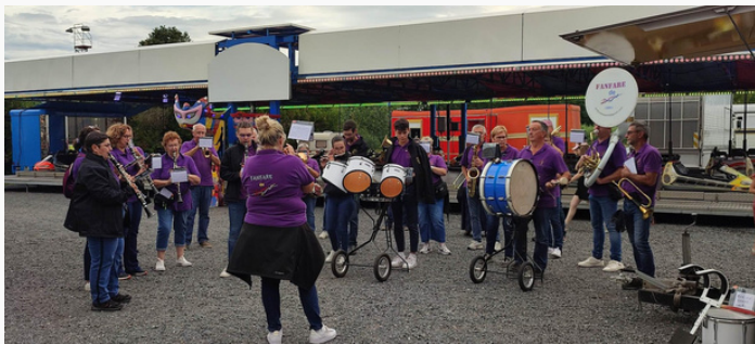
La fête Patronale les 28, 29 et 30 Juillet