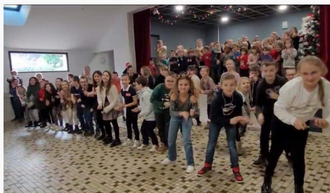
Noël des enfants de l'école