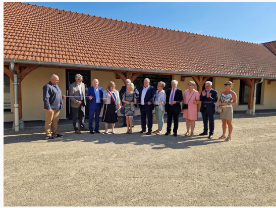
L'inauguration du Groupe Scolaire du Péage le 2 septembre 2023