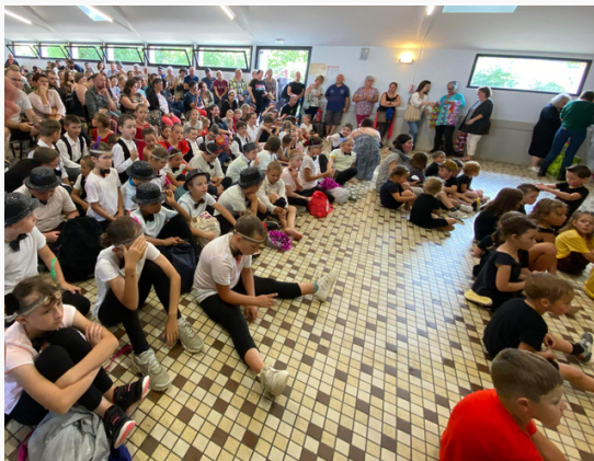
La fête des écoles le 1er Juillet