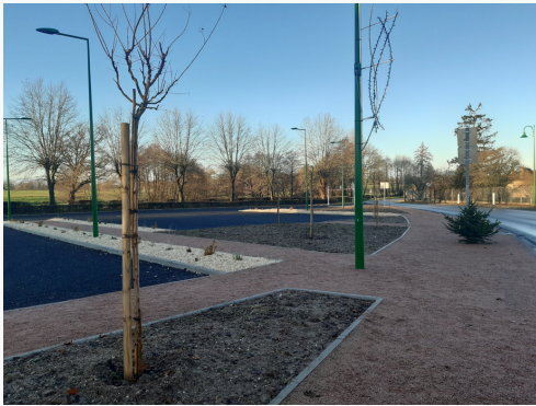
Le parking de l'école