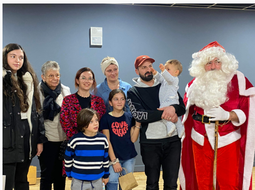
Marché de Noël