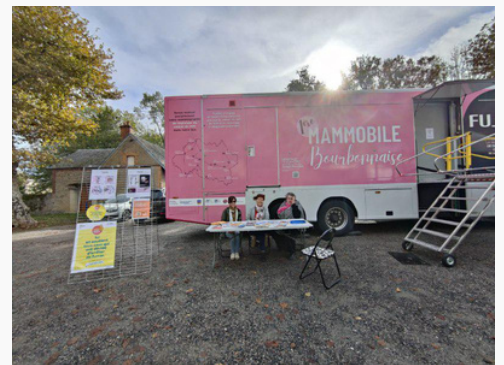
Mammobile à Dompierre sur Besbre