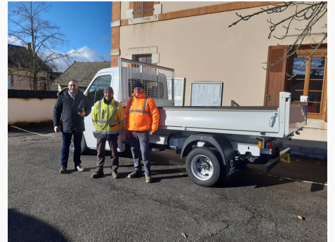
Un nouveau camion pour la commune