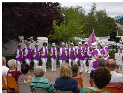
Les Mamirettes ont fait leur show