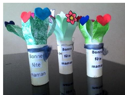
Objets réalisés par les enfants de l'école du Péage pour la fête des mères