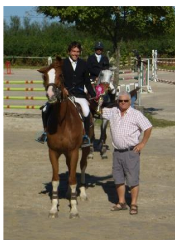
Concours de sauts d'obstacle

La fête patronale (samedi 30, dimanche 31 juillet et lundi 1 er août)