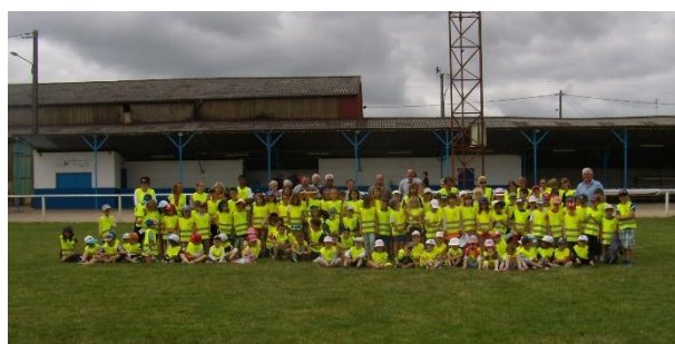
GROUPAMA a offert des gilets jaunes aux enfants scolarisés à Thiel, ils seront utilisés pour les déplacements