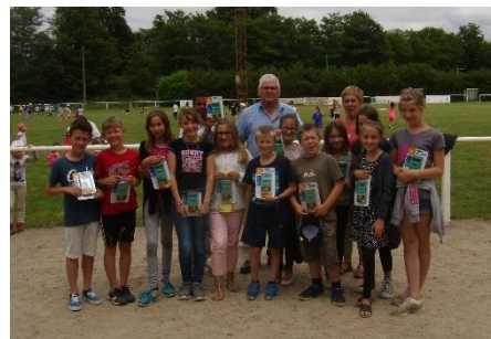
La remise des calculettes aux enfants entrant en 6 ème en septembre