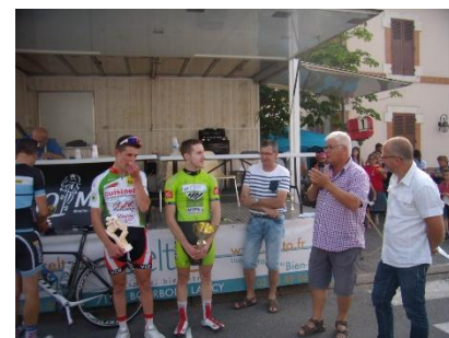
Les vainqueurs de la course du lundi

La fête patronale (samedi 30, dimanche 31 juillet et lundi 1 er août)