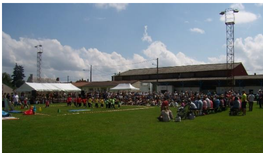
La fête des écoles