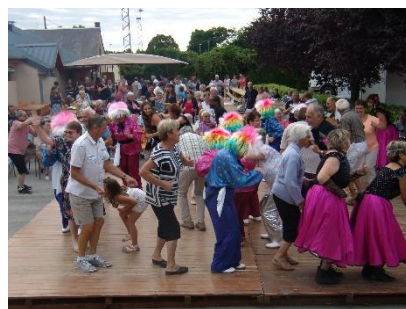
Et tout le monde a dansé