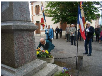
Commémoration de la Bataille de Verdun