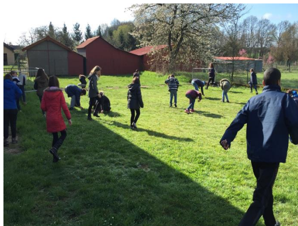
La chasse aux œufs de Pâques

Les autres manifestations non illustrées : Concours pétanque triplète, Loto des Parents d'élèves, Théâtre Thiel Gym Volontaire, Concours de belote du Cercle Thiémois de l'Amitié, Journée Vétérans en club (Pétanque), Brocante du Comité des Fêtes, Exposition Thiel Accueil, 7ème régional (pétanque).