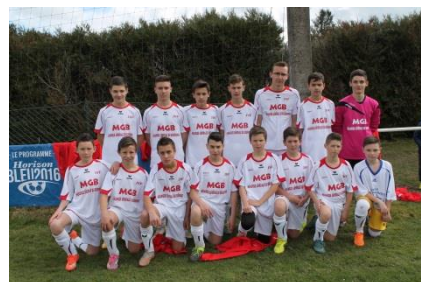
L'équipe de foot de Thiel présente au TIF'M 2016