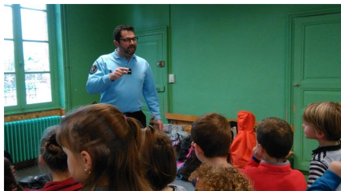
Les gendarmes sont venus à l'école du Péage et à l'école du Marronnier pour expliquer les dangers d'internet