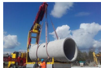
La station d'épuration (avancement des travaux)