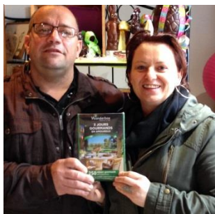
Les gagnants de la tombola organisée par les commerçants de Thiel sur Acolin